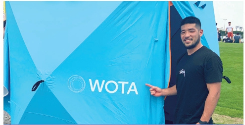
神奈川県様ラグビー大会にて活用