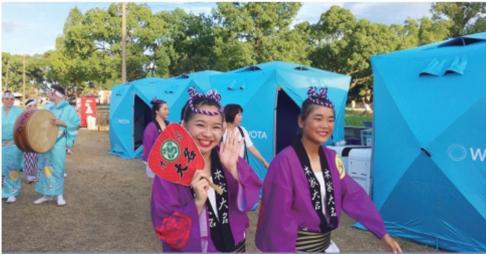
徳島JC様・お祭りにて活用

緊急・災害時の利用だけでなく、日常的な地域のイベントや屋外施設の入浴設備としてご利用いただくことも可能。 地域の方々の日常に溶け込む機器として日々利用されることで、緊急時にもスムーズに設置・利用いただけます。