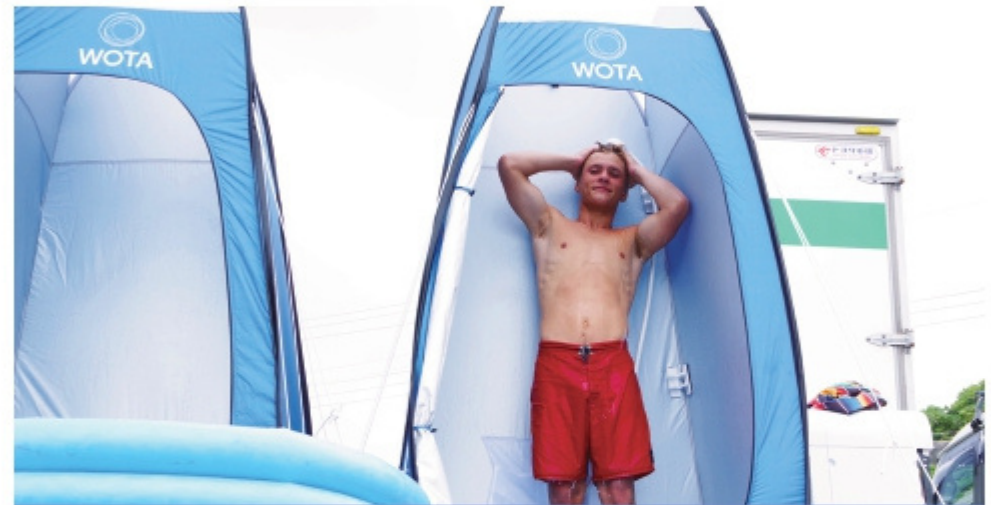
オリパラ組織委員会様・サーフィン活用