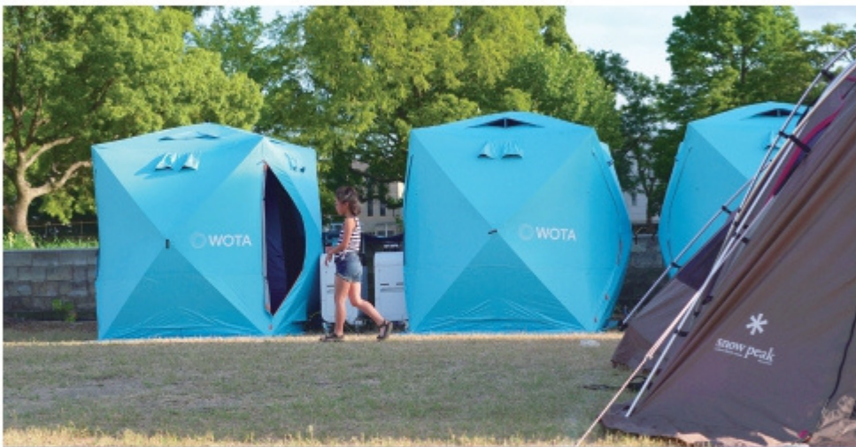
良品計画様・キャンプ施設にて活用